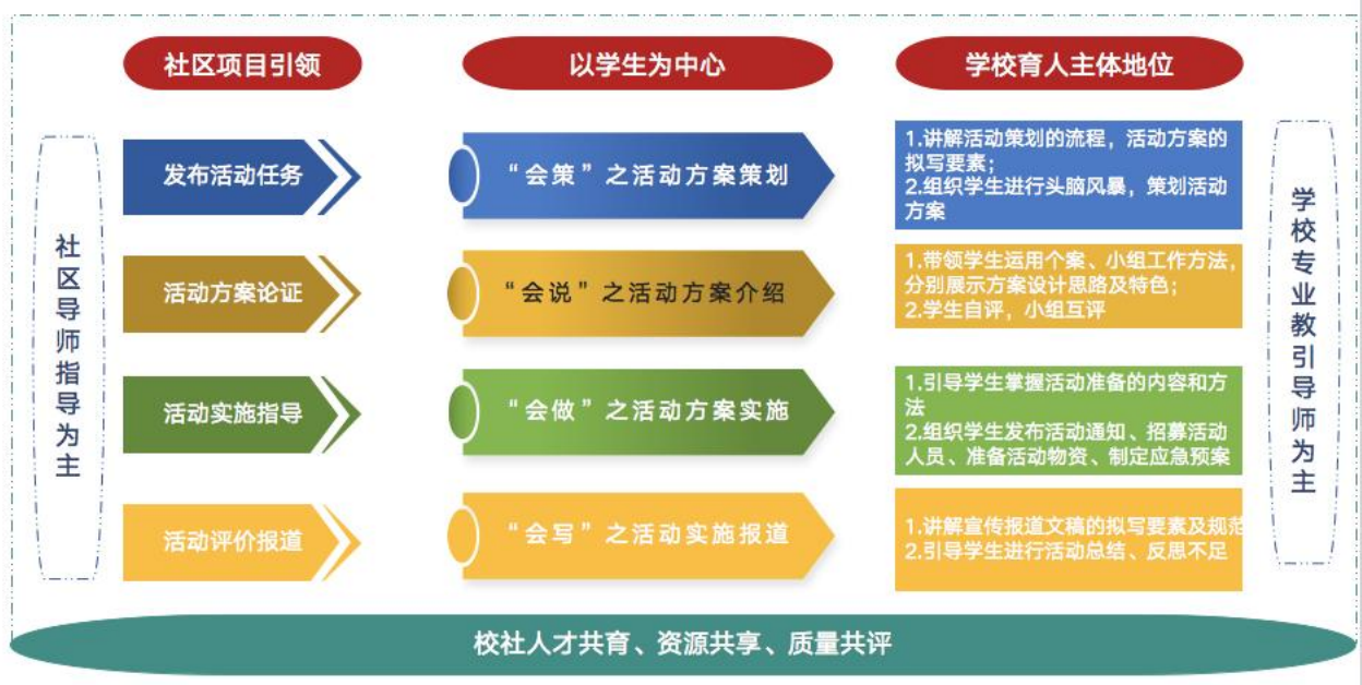
图4 双景双师，项目引领，校社协同育人

与清波社区紧密合作，结合社区服务实际项目需求，由社区导师发布活动的目的和意义、具体要求、大致流程、文案格式和主要内容，并负责方案的评估、活动组织实施指导及质量评价；学校专业教师负责引导学生进行活动开展前的方案设计 with 活动准备环节，包含探寻活动需求、拟写活动方案、论证活动方案，以及发布活动通知、招募活动人员、准备活动物资、制定应急预案等任务环节。