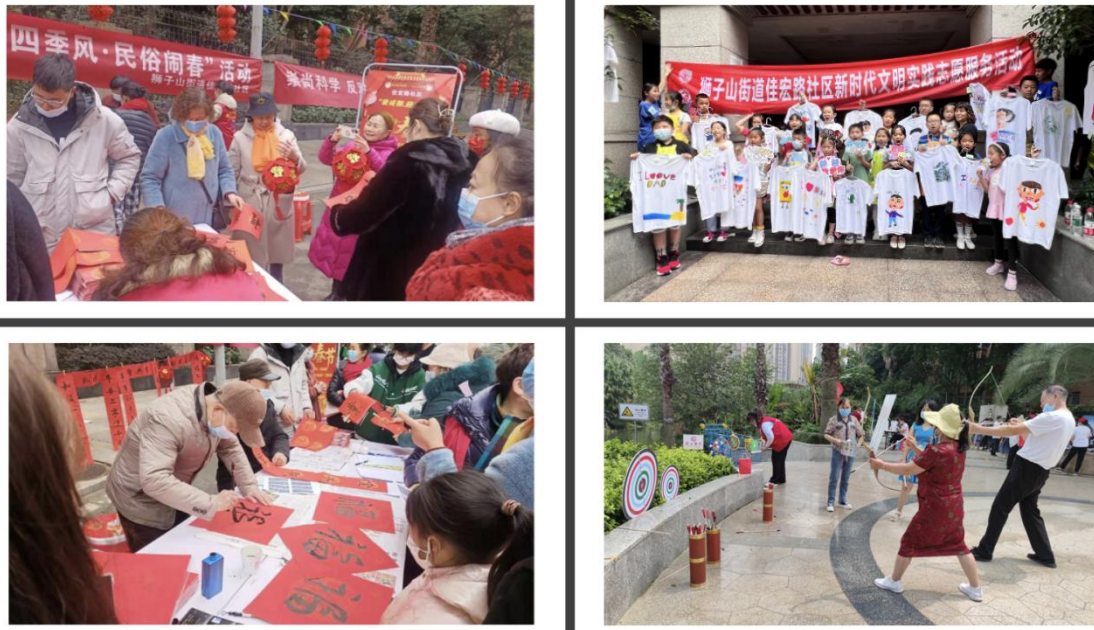
图9 社区活动服务案例