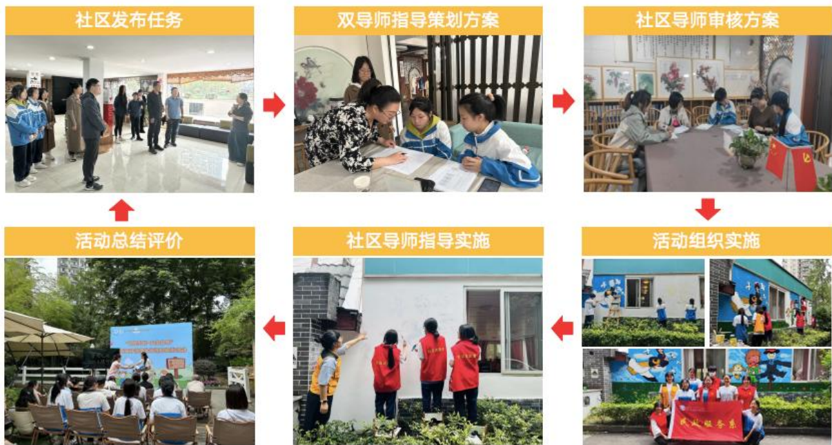
图5 社区真实项目实践

与清波社区紧密合作，结合社区服务实际项目需求，由社区导师发布活动的目的和意义、具体要求、大致流程、文案格式和主要内容，并负责方案的评估、活动组织实施指导及质量评价；学校专业教师负责引导学生进行活动开展前的方案设计 with 活动准备环节，包含探寻活动需求、拟写活动方案、论证活动方案，以及发布活动通知、招募活动人员、准备活动物资、制定应急预案等任务环节。