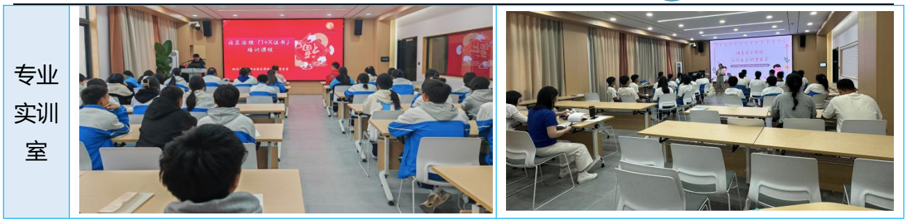
图6 丰富教学课程资源