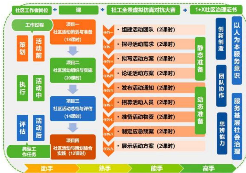
图 1 岗课赛证融合课程体系

按照人才培养方案和课程标准要求，基于社区活动策划工作过程，结合社区工作者和社区社会工作者岗位典型工作任务，打破原有课程体系，将“1+X”社区治理职业技能证书要求、社会工作全景化虚拟仿真对抗大赛考核知识点融入课程教学内容，将课程内容按照活动前——活动中——活动后的工作过程和技能递进的要求，将教学内容重构为社区活动策划与准备、社区活动组织与实施、社区活动总结与评估、社区活动与策划综合实践四个项目。