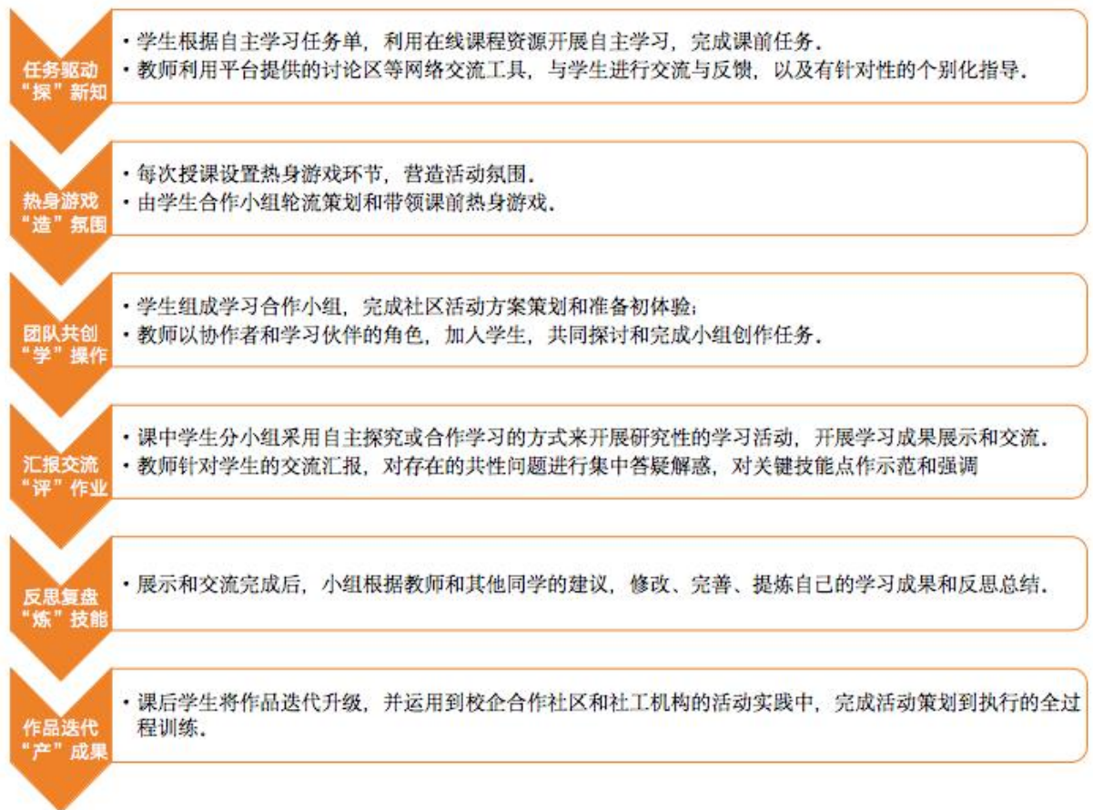
图 3 “三阶六环” 教学实施